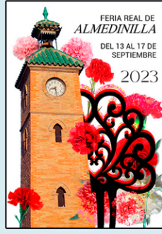
DANIELA PORRAS MESA